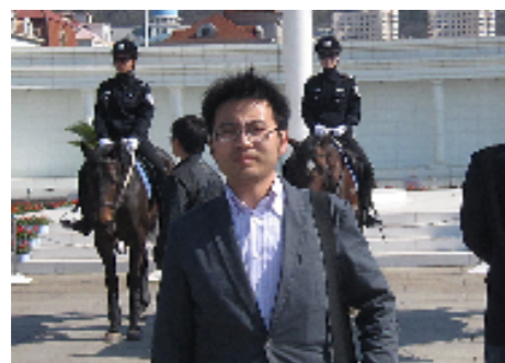
▲故郷大連の人民広場の前