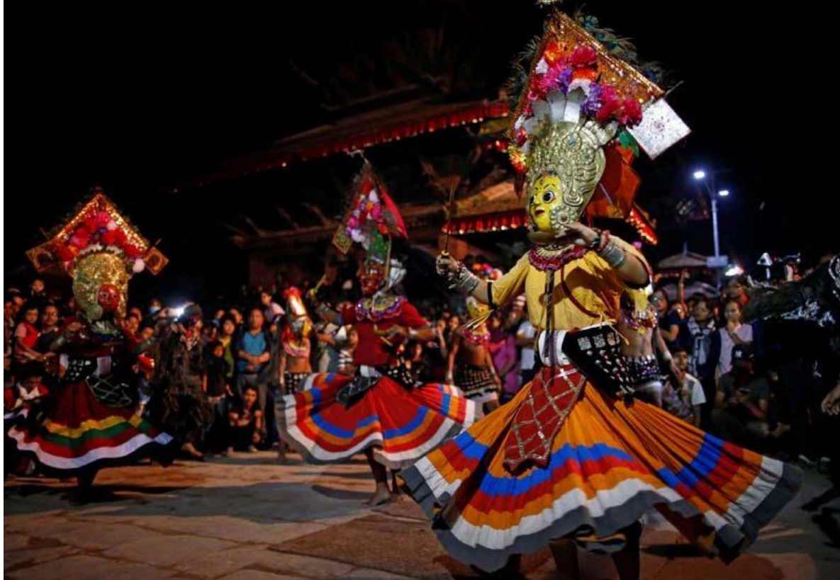
Illustration by: Sallendra Manandhar